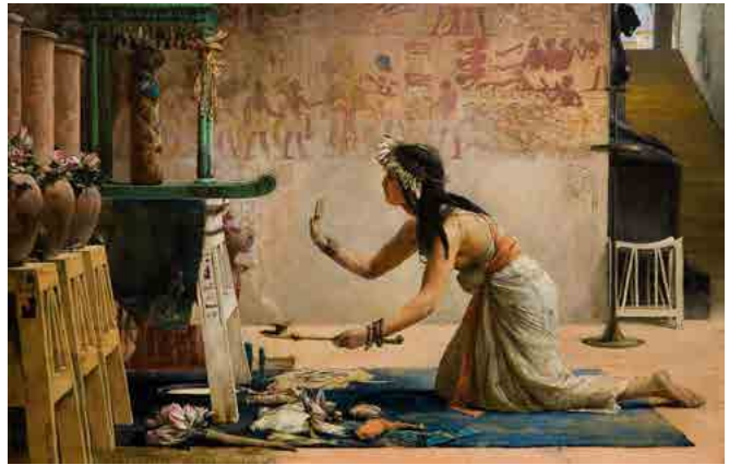
Aanbidding van de kat in Oud-Egypte

Kattengodinnen waren er in het oude Egypte genoeg. Een bijzondere rol was weggelegd voor Mafdet met haar kattenkop, die beschermend kon optreden met haar klauwen. In het hiernamaals bracht ze de uit lichamen van foute mensen gerukte harten naar de farao. De naam Bast, een andere kattengodin, is al gevonden in het begin van de periode waarin de piramides zijn gebouwd, ze werd toen ook wel Pa-Bast genoemd, waarvan Pasht een afgeleide lijkt te zijn. In Pashts tempel werden zieke katten ver-